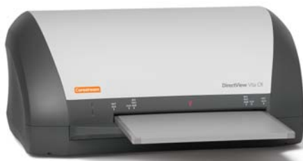
DIRECTVIEW Vita CR