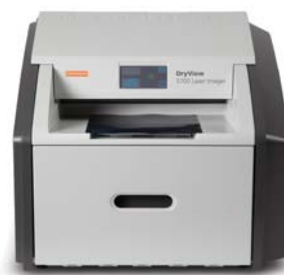
Reprographe laser DRYVIEW 5700